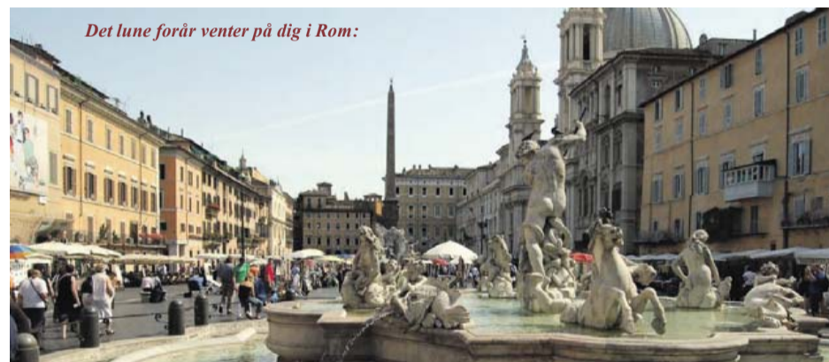
Det lune forår venter på dig i Rom:

Tag nogle energifulde solskinsdage med hjem fra en lun og dejlig rejse til Rom