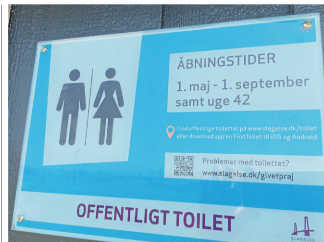
Der er sat nye skilte op ved toiletterne, så man kan melde om fejl og mangler.