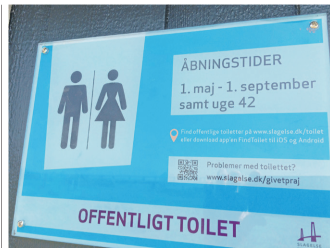
Der er sat nye skilte op ved toiletterne, så man kan melde om fejl og mangler.